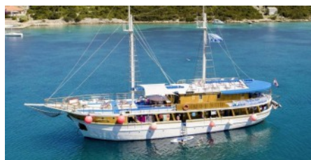
Motorsegler MS Otac Ivan | Kategorie Comfort Plus

Hinweis: Änderungen im Reiseverlauf und beim Schiff behalten wir uns vor.